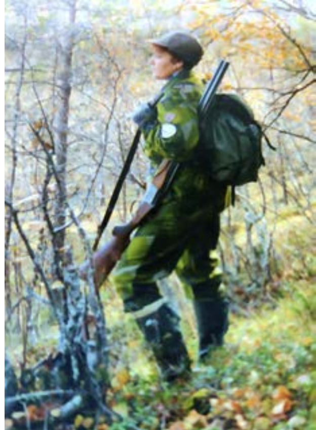
Riekonpyynnissä Inarin Satajoella syksyllä 1994.

Kurssin aikana joku vanhempi miespuolinen kyllä ihmetteli ääneen, että mitä siitäkin tulee kun kaikki, koko perhe ja koira, on metsällä. Kuka tekee kotihommat, eväät ja lämmittää saunan? Tähän riistapäällillö vastasi: Hän joka jaksaa ja ensiksi ehtii. Keskustelu loppui lyhyeen.