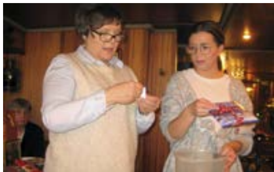
Ja voittaja on....