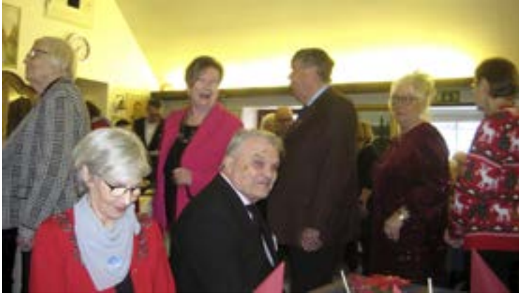
Hyvää kannattaa jonottaa.

nykyään omat sotilaskuljettajansa kasvaneisiin kalustolajeihin. Haasteenamme onkin löytää sotilaskuljettajat yksiköistä ja saada automieskipinä heihin syttymään. Toimintavuosi 2024 alkaa olla loppuillaan ja on aika kiittää teitä automiesperinteen vaalimisesta sekä hiljentyä lähestyvään vuoden suureen juhlaan, joulun. Toivon että mahdollisimman monella on mahdollista viettää joulua läheis-